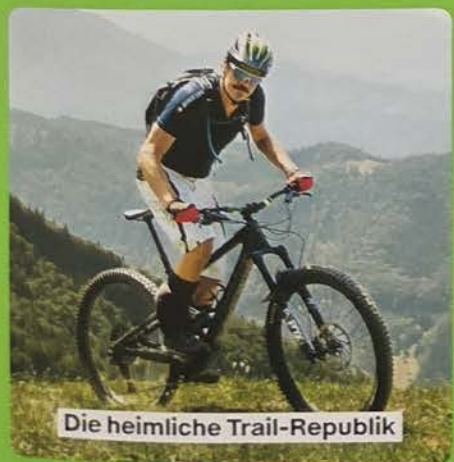
Die heimliche Trail-Republik