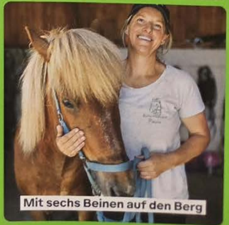
Mit sechs Beinen auf den Berg