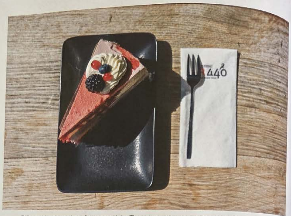
Dünne Luft, voller Genuss: Alle Touren enden beim Café 3440, wo bereits die saftige Buchweizentorte aus der hauseigenen Konditorei wartet.

Moderne Architektur mit Blick auf Dutzende Dreitausender und Gletscher. Bekannt ist das höchste Café Österreichs für Barista-Kaffee und Torten aus der hauseigenen