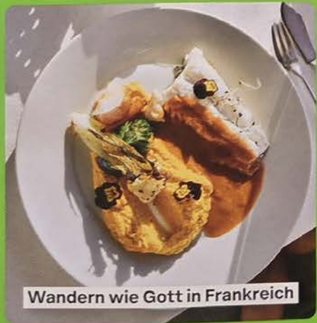
Wandern wie Gott in Frankreich