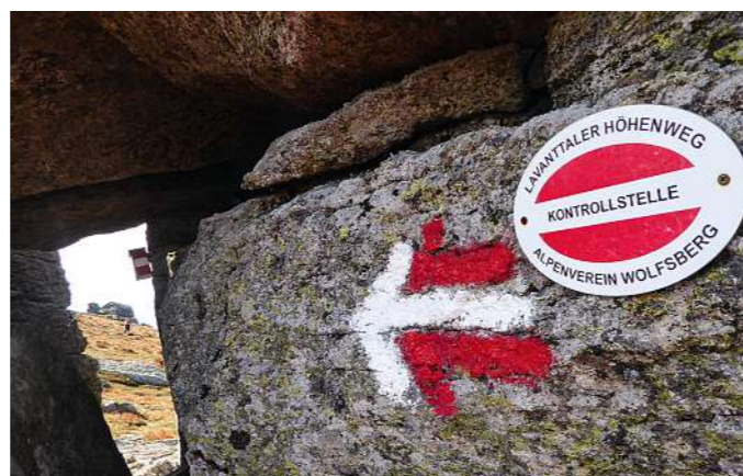
Weg über die Stumpfmauer (o.r.) im Nebel über das Kettentörl, wo die Hirsche röhren; [2. Reihe l.]. Die Mödlinger Hütte im Gesäuse [3. Reihe r.]. Von der Stumpfmauer in Kärnten zum Tanzboden unterwegs [4. Reihe r. und l.]