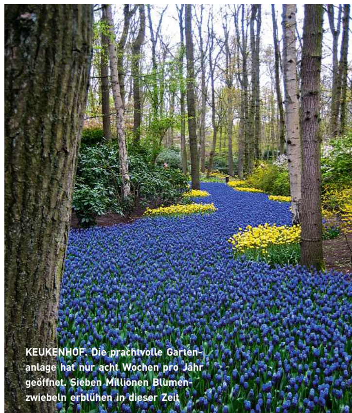
KEUKENHOF. Die prachtvolle Gartenanlage hat nur acht Wochen pro Jahr geöffnet. Sieben Millionen Blumenzwiebeln erblühen in dieser Zeit

gewaltige Deiche von der Nordsee getrennt. Mehr als die Hälfte der Niederlande liegt fast auf Meereshöhe, 3000 Kilometer Deichanlagen schirmen das Land von Überschwemmungen durch die Gezeiten oder Sturmfluten ab. Um mehr Boden für die Landwirtschaft nutzbar zu machen, hatten die Holländer schon im Mittelalter ausgeklügelte Entwässerungstechniken entwickelt. Windmühlen trieben Schöpfräder an und legten das Watt trocken. Immer noch sind mehr als 1000 Windmühlen in Holland verstreut, wengleich die meisten mittlerweile zu urigen Villen oder Hotels umgebaut wurden. In Kinderdijk stehen gleich 19 majestätische Mühlen aufgefädelt an mehreren Entwässerungskanälen, am besten lässt sich die Anlage per Fahrrad erkunden. Wer bei der nahe dem Parkplatz gelegenen Museumsmühle nicht umdreht, entkommt dem Rummel. Im Juli und August werden wieder alle Mühlen in Betrieb sein, ihre mächtigen Flügel im Wind drehen und wie vor dreihundert Jahren rauschen.