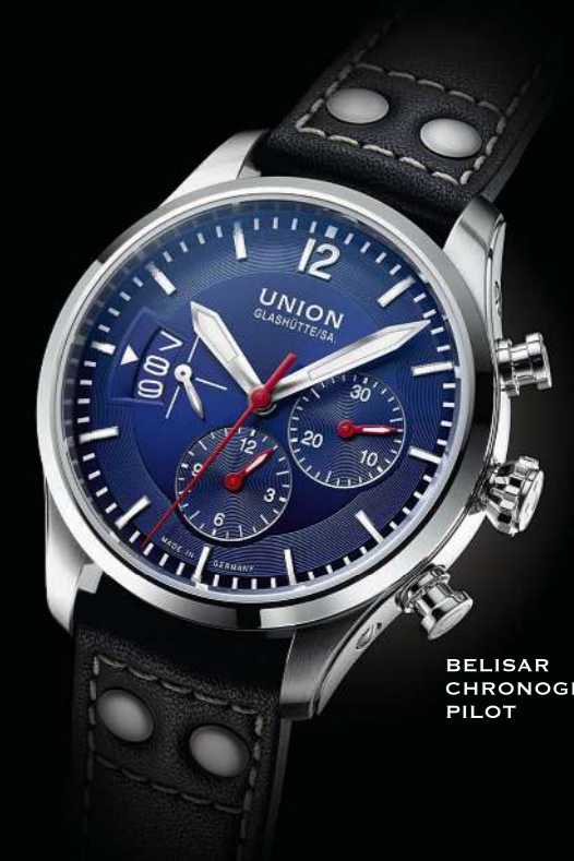
BELISAR CHRONOGRAPH PILOT

VOM TRAUM ZU FLIEGEN, DEM KLANG DER MOTOREN UND DEM TICKEN DER ZEIT.