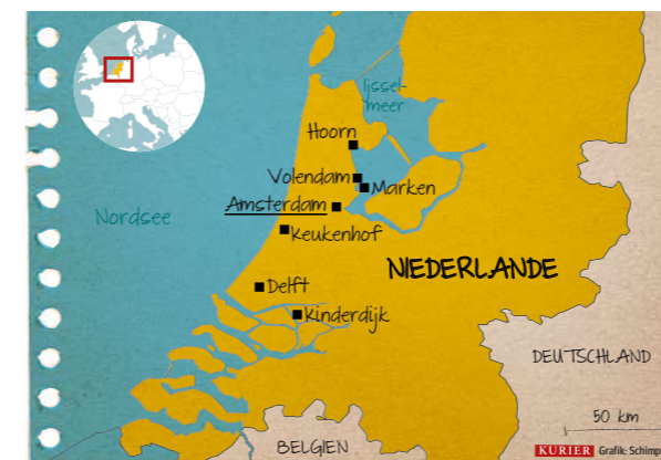
FOTOS: BEELDBEWERKING/GETTY IMAGES/ISTOCKPHOTO, CLAUDIA SCHANZA, LAURENS LINDHOUT/KEUKENHOF; GRAFIK: CHRISTASCHIMPER

Flüge mit AUA oder KLM zum Flughafen Schiphol. ←